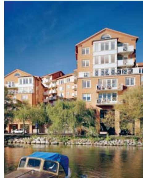
Tranebergs strand 1